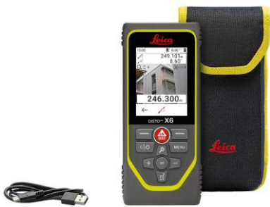
Leica DISTO™ X6 Art. Nr. 950909

Leica DISTO™ X6, Tasche, USB-C auf USB-A Kabel, Handschlaufe, Kurzanleitung, Garantiekarte, Sicherheitshandbuch, Kalibrierungszertifikat Silber