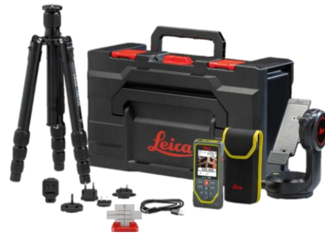
Leica DISTO™ X6-P2P Package Art. Nr. 950878

Leica DISTO™ X6, Tasche, USB-C auf USB-A Kabel, Handschlaufe, Kurzanleitung, Garantiekarte, Sicherheitshandbuch, Kalibrierungszertifikat Silber